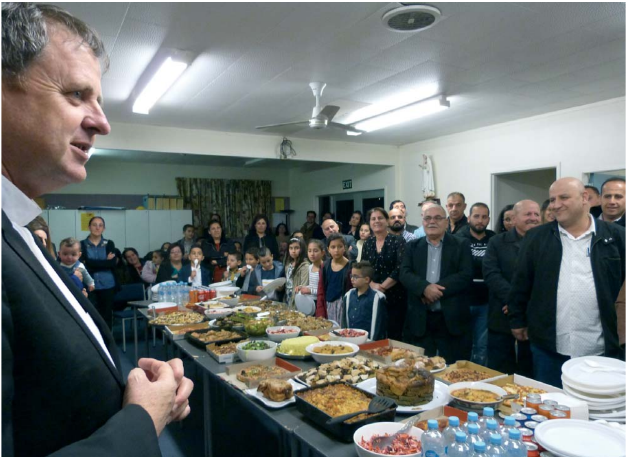
Momento conviviale organizzato in onore dei profughi iracheni sostenuti dall'Ordine del Santo Sepolcro accolti in maniera particolare da Mons. Steve Lowe, vescovo di Hamilton.

tas Aotearoa Nuova Zelanda, affiliata locale di Caritas Internationalis.