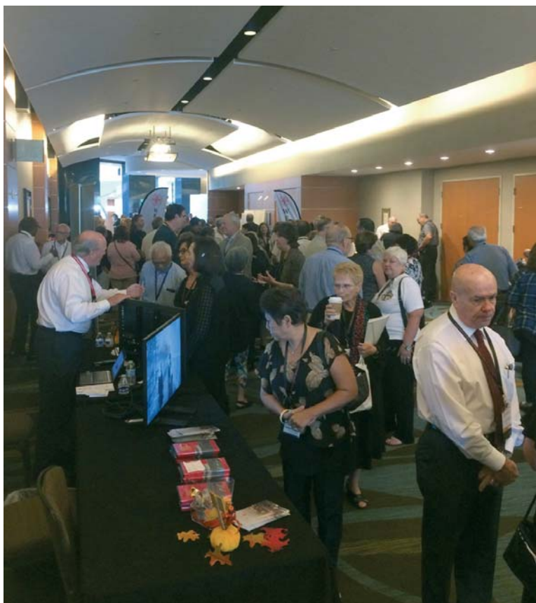
La Luogotenenza per gli USA Western presenta i progetti portati avanti in Terra Santa in occasione dell'incontro annuale di Luogotenenza che suscita al contempo interesse e generosità.

La 'Ministry Fair' ha dato la possibilità di presentare varie realtà come la Casa di San Vincenzo, la