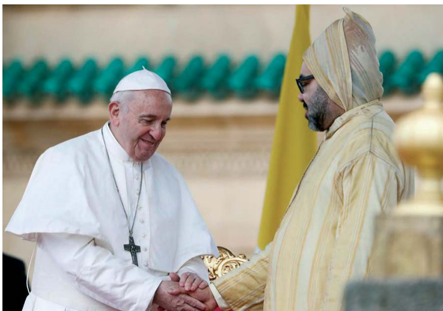
Nel corso dell'incontro privato presso il Palazzo reale di Rabat, Mohammed VI e Papa Francesco hanno sottoscritto un appello comune volto a riconoscere l'unicità e la sacralità di Gerusalemme.

ferma il Documento, - «simbolo dell'abbraccio tra Oriente e Occidente, tra Nord e Sud e tra tutti coloro che credono che Dio ci abbia creati per conoscerci, per cooperare tra di noi e per vivere come fratelli che si amano».