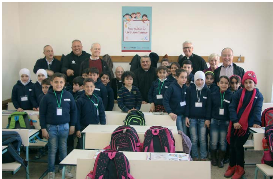
La Chiesa Cattolica in Terra Santa è molto impegnata nell'accoglienza dei rifugiati del Medio Oriente, soprattutto nell'organizzazione dei servizi scolastici dei bambini e dei giovani. L'Ordine ha largamente contribuito a queste azioni nel 2015 attraverso una generosa donazione alla Caritas giordana

Interrogato su cosa muove le varie istituzioni ad impegnarsi così profondamente per questi fratelli che fuggono dalla guerra, padre Bader risponde: «La Giordania è un porto sicuro per la pace nella regione. Il nostro dovere, in quanto cittadini e cristiani, è quello di alleviare le sofferenze delle persone. Mi sono reso conto che questa gente ha perso tutto nella vita: case, lavori, proprietà, attività. Hanno anche perso ogni barlume di speranza di poter vivere una vita senza problemi. Hanno perso il loro futuro ed è nostro dovere ridare loro speranza con i mezzi che abbiamo. Questo è il messaggio che abbiamo imparato dal Vangelo».