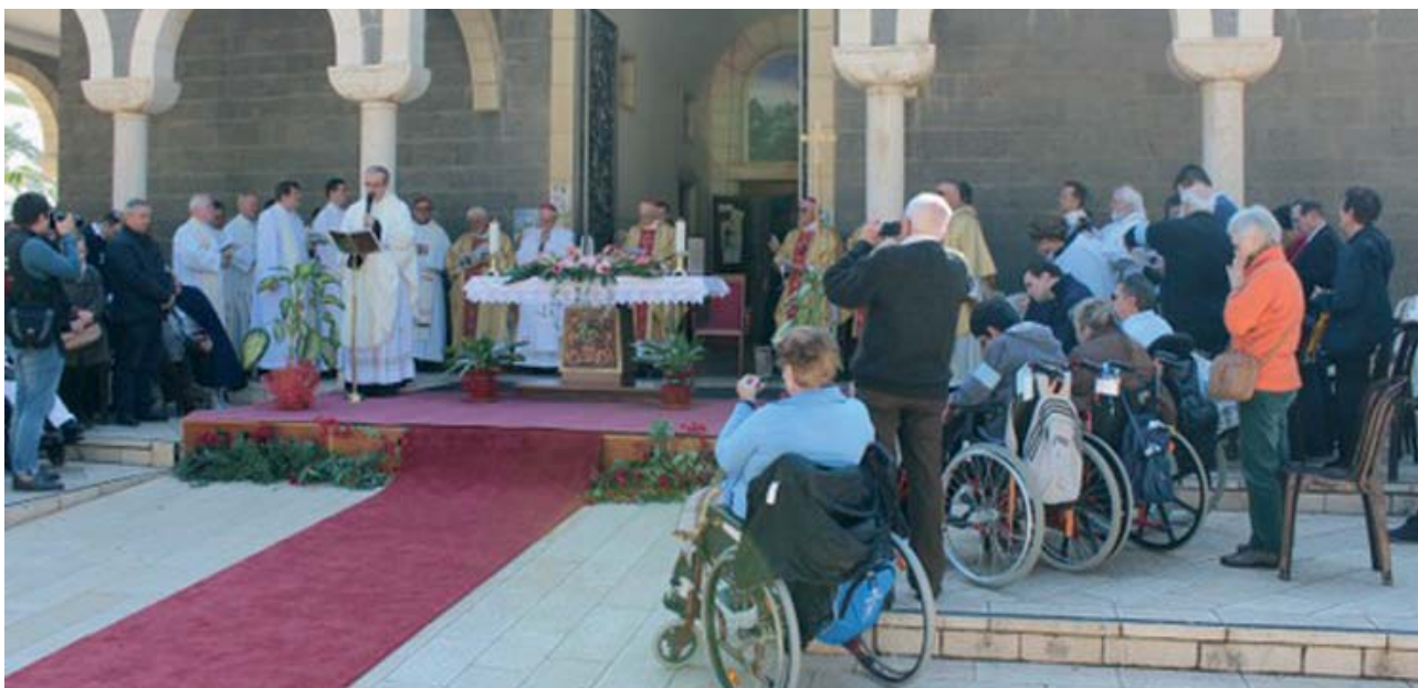
Una delegazione del Vaticano guidata dal Presidente del Pontificio Consiglio per la Pastorale della Salute ha partecipato quest'anno alla celebrazione della XXIV Giornata mondiale del Malato in Terra Santa. L'evento, che ha avuto luogo a Nazareth l'11 febbraio, è stata l'occasione per un pellegrinaggio, dal 6 al 13 febbraio, durante il quale la delegazione ha visitato anche il Monte delle Beatitudini per una messa alla quale hanno partecipato varie persone disabili (nella foto).

vere il sacramento dell'Unzione degli infermi.